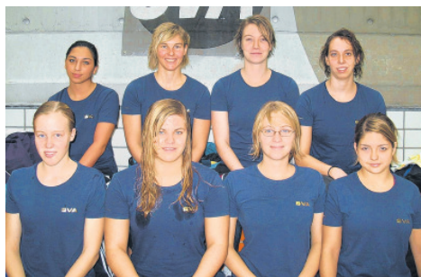
Diese Damen des SVA schaffen den Klassenerhalt in der Bayernliga.